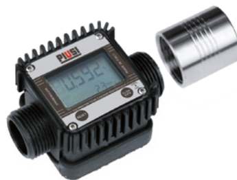
K24 VERSIÓN DE PLÁSTICO